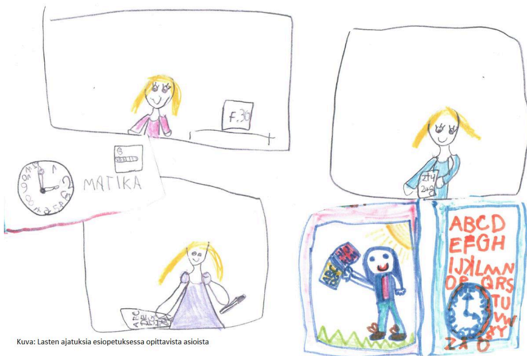
Kuva: Lasten ajatuksia esiopetuksessa opittavista asioista