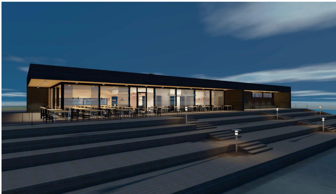
Kuva: Haromaa & Partners Arkkitehtitoimisto

Kaarinan kaupunki avaa teoshaun, jonka tavoitteena on löytää pysyvää julkista taidetta Hovirinnan uuteen rantasaunaan ja sen yhteyteen. Teoshaun teemana on vesi, merellisyys, luonto ja sauna. Teokselle/teoksille on varattu kokonaisuudessaan 16 000 euroa. Teoshaku on käynnissä 20.6.-25.8.2024, ja se toteutetaan Kaarinan kaupungin prosenttiperiaatteen taidehankintana.