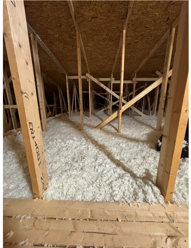
Puhallusvilla asennettu ullakkotilaan.