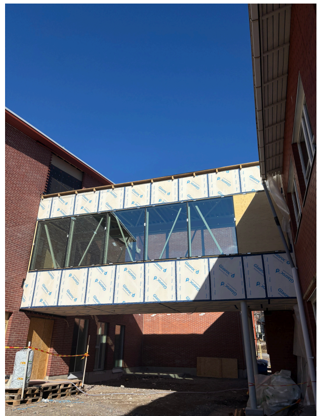
Yhdyskäytävä odottaa julkisivulevytytystä.