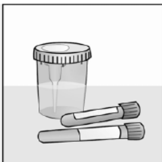
Kuva 1. Virtsanäytepurkki sekä näyteputket (2 kpl).