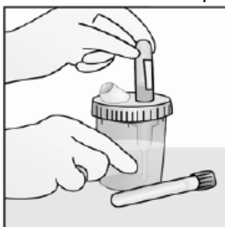
Kuva 3. Virtsanäyteputkien täyttäminen.