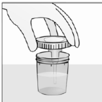
Kuva 2. Virtsanäytepurkin sulkeminen.